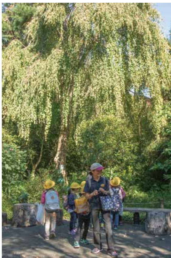
アリタキ植物園のシダレカツラ 緑陰の頃